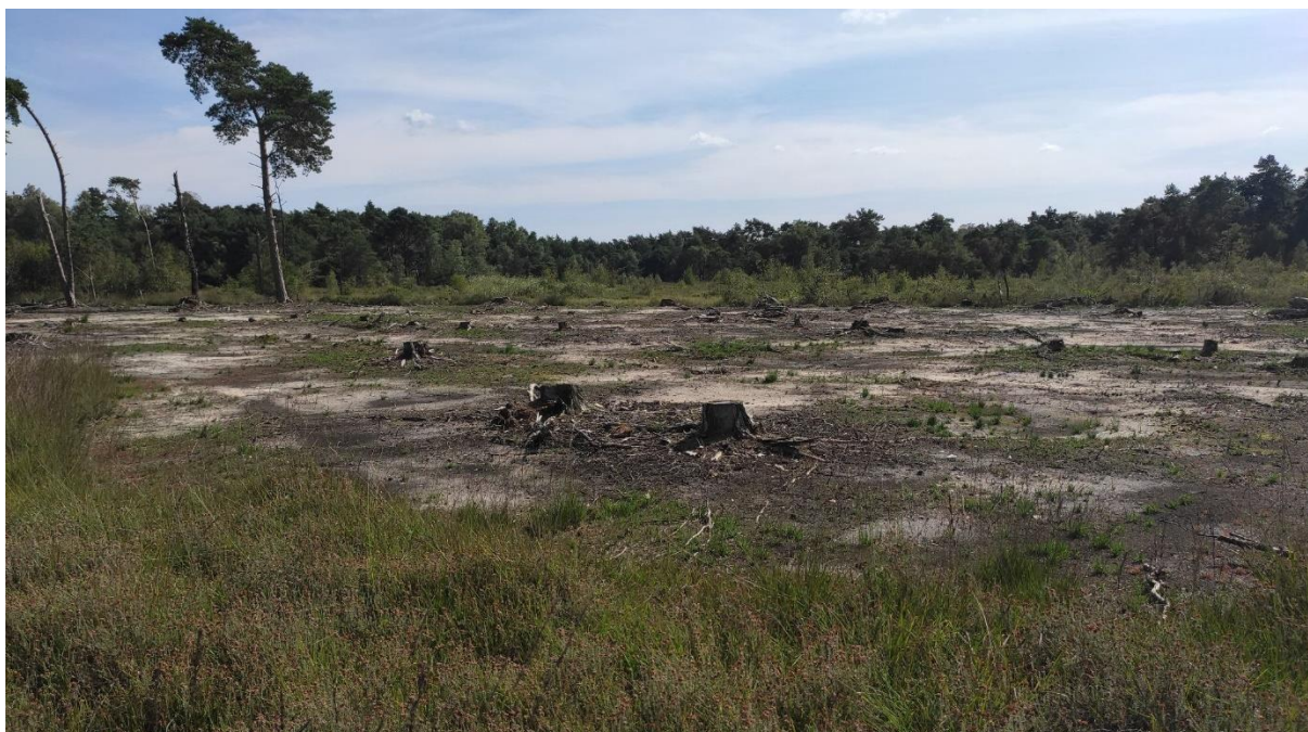
Afbeelding 1: Oengekapte verbinding tussen heideterreinen

In landgoed Twickel zijn bijzondere restanten bewaard gebleven van de eertijds uitgestrekte Twentse natte heideterreinen. Deze heide loopt gevaar dicht te lopen met boomopslag, met name op de wat drogere delen. De heide valt daardoor uiteen in kleinere percelen, gescheiden door bos. In de winter 2020-2021 heeft de beheerder van het landgoed weer verbindingen gemaakt tussen geïsoleerd geraakte heideterreinen door tussenliggend bos weg te kappen en de bodem af te plaggen. Dit moet op de langere termijn de levenskansen voor de specifieke flora en fauna van de heide vergroten. Op de korte termijn kan het succes van de maatregel het best afgemeten worden door te signaleren welke soorten zich vestigen in de verbindingstroken zelf. In augustus 2021 is hiertoe een flora-inventarisatie uitgevoerd. Daarbij zijn de volgende indicatieve soorten aangetroffen: