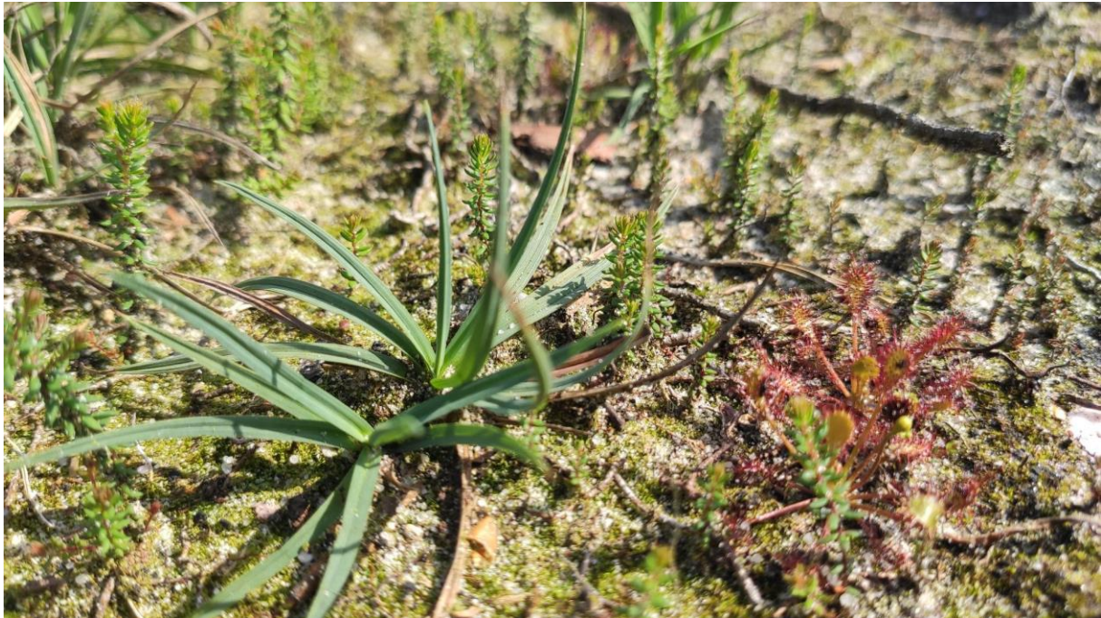
Afbeelding 2: Blauwe zegge, Kleine zonnedaaw en Dophei

Opmerkelijk is dat Moeraswolfsklauw ( Lycopodiella inundata ) niet is aangetroffen terwijl deze soort wel voorkomt in de bestaande heide. Mogelijk heeft deze sporenvormende soort een wat langere ontwikkeltijd dan de zaadplanten. Een soort die zich ook nog niet vanuit de omringende heide heeft gevestigd is Veenbies ( Trichophorum germanicum ).