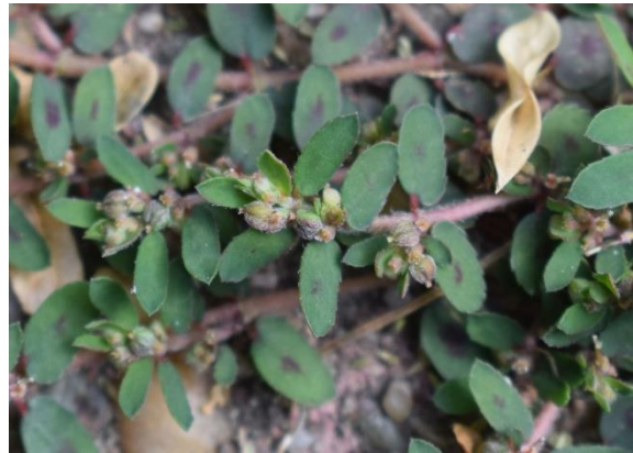
Foto 7 Euphorbia maculata