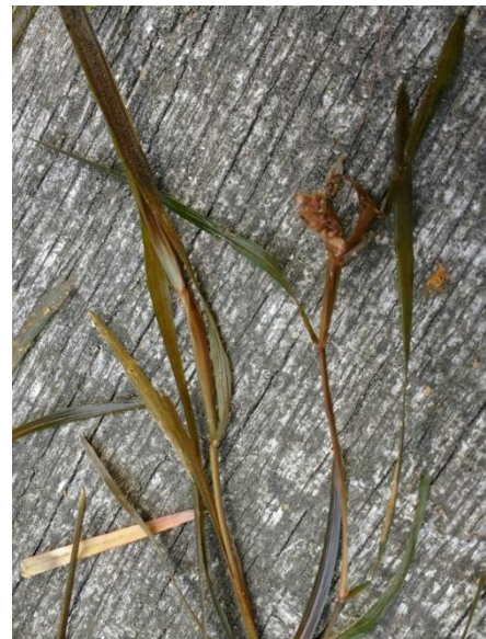
Foto 11 Potamogeton compressus

1 (6) 228-515: Noord-Stegeren, in een sloot (excursie FWT). Terugvondst; laatste waarneming 1998.