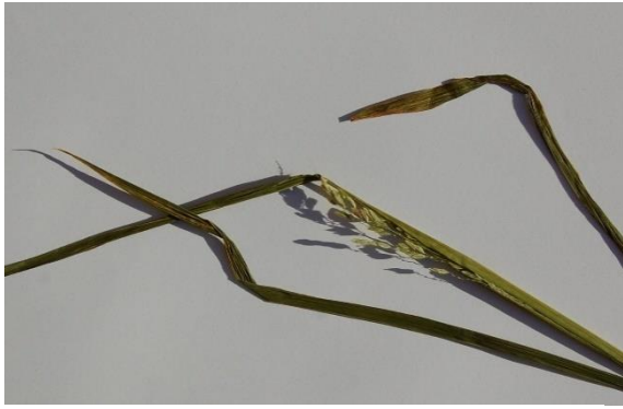
Foto 10 Leersia oryzoides