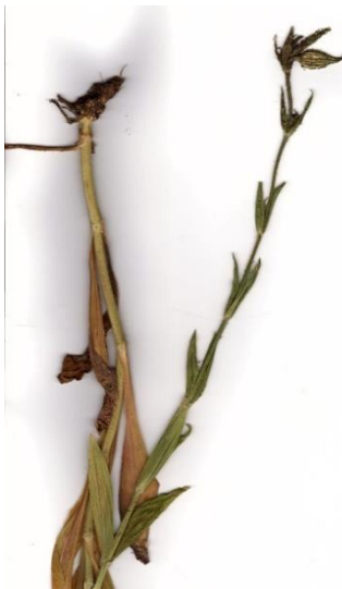
Foto 13 Silene noctiflora