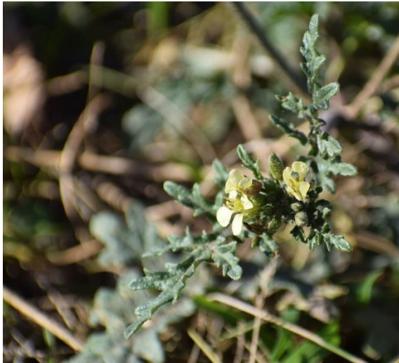
Foto 6 Erucastrum gallicum