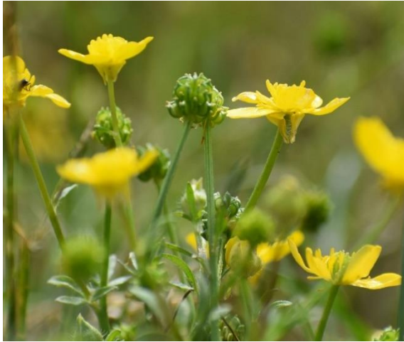
Foto 12 Ranunculus sardous