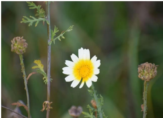
Foto 8 Glebionis coronaria