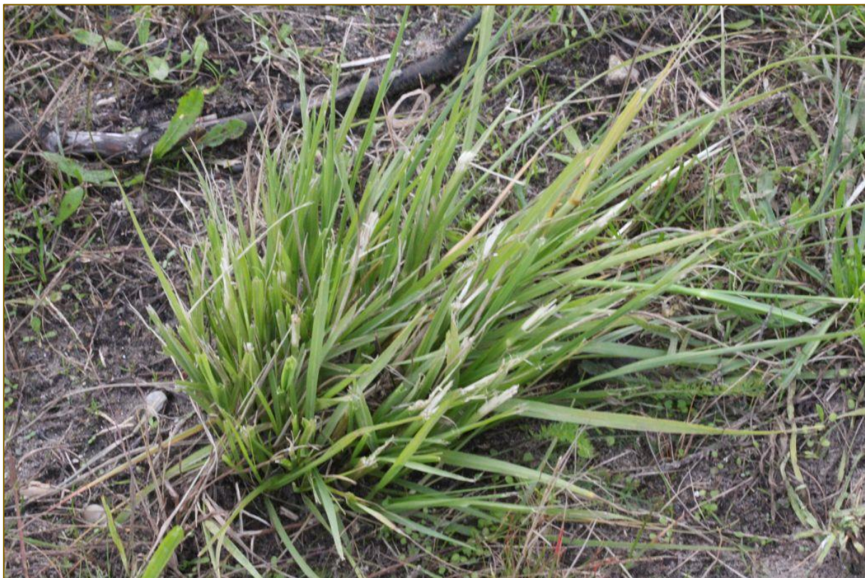
Afb.29 De Sporobolus indicus zag er na een maaibeurt zo uit, maar zou de winter goed kunnen overleven.