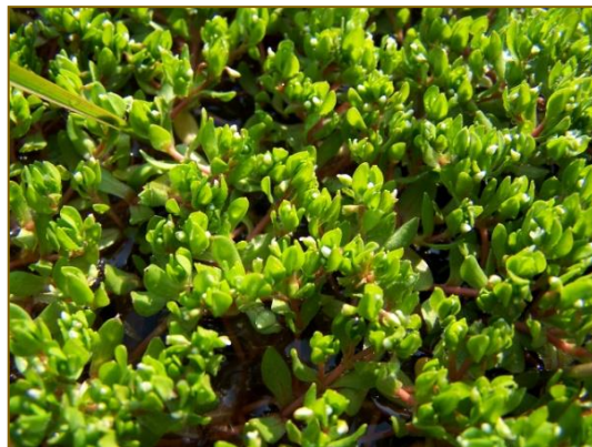
Afb. 25 Montia minor

Kilometerhok 263-484, west van de Hakenberg bij Oldenzaal, was al meer dan tien jaar gelden voor het laatst onderzocht. We vonden tijdens de excursie veel van de bijzondere bossoorten terug: langs de Hakenbergweg noteerden we naast Viola riviniana en V. reichenbachiana (Donkersporig en Bleeksporig bosviooltje) en Lamium galeobdolon subsp. galeobdolon (Gele dovenetel) ruim 25 pollen Carex sylvatica (Boszegge) en enkele tientallen exemplaren Neottia ovata (Grote keverorchis). Aan een natte slenk nabij de Populierendijk was een dertigtal planten Valeriana dioica (Kleine valeriaan) een verrassing; ze werd hier