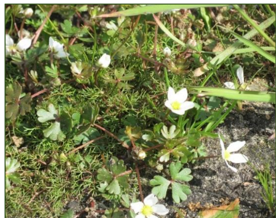
Ranunculus ololeucos