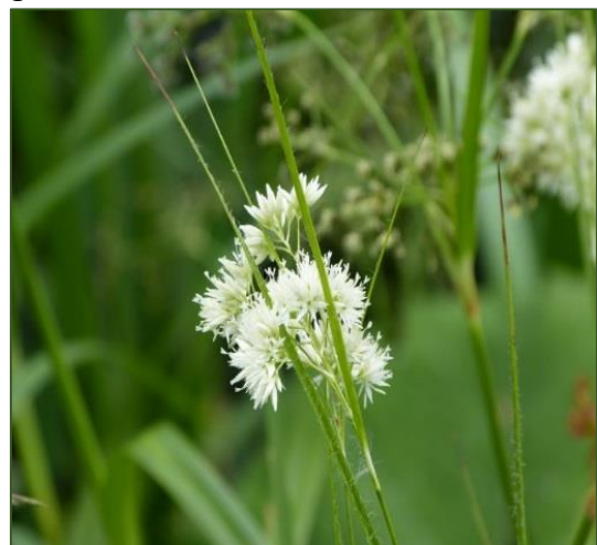
Luzula nivea