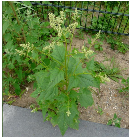
Chenopodium hybridum