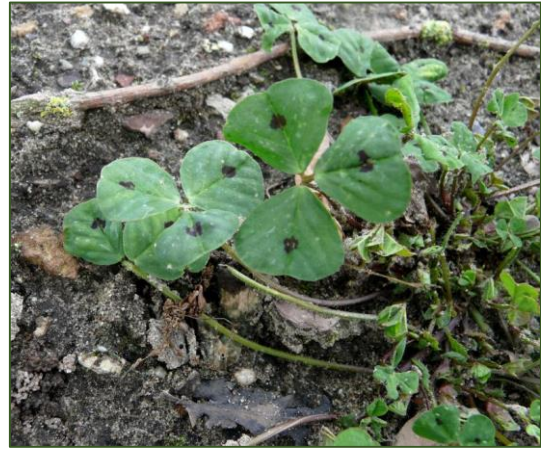
Medicago arabica