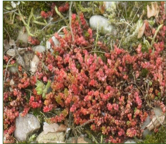
Crassula tillaea