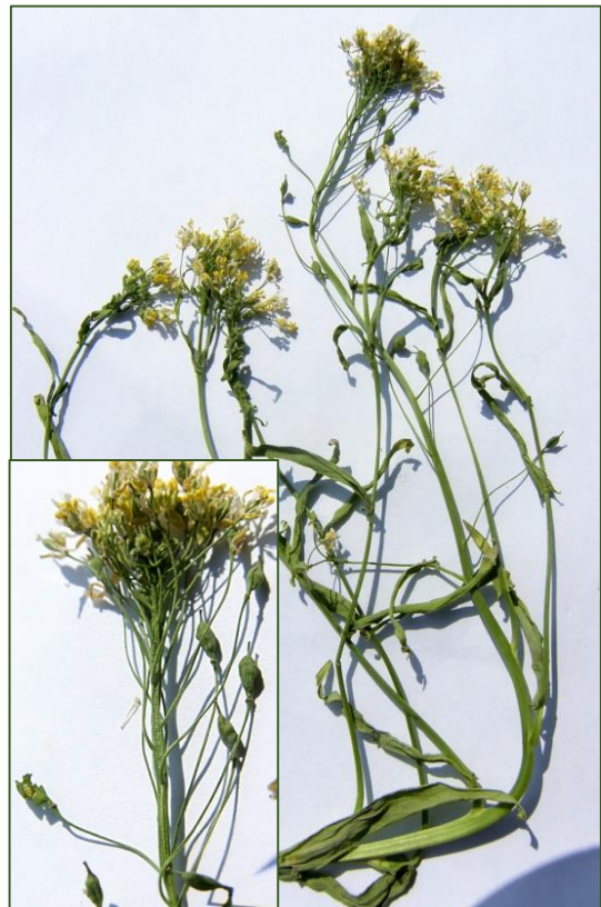
Camelina sativa subsp. sativa