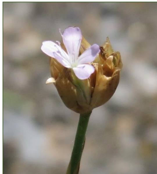
Petrorhagia prolifera