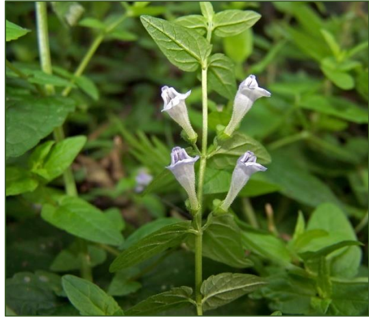
Scutellaria x hybrida