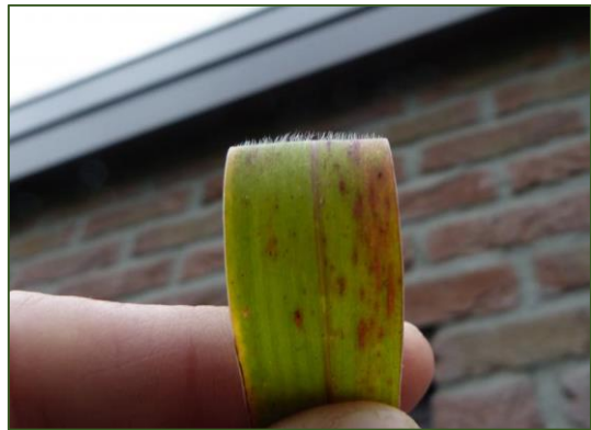
Setaria faberi