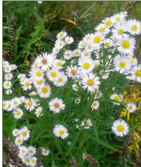
Symphotrichum lanceolatum

263-471 Glanerbrug, station