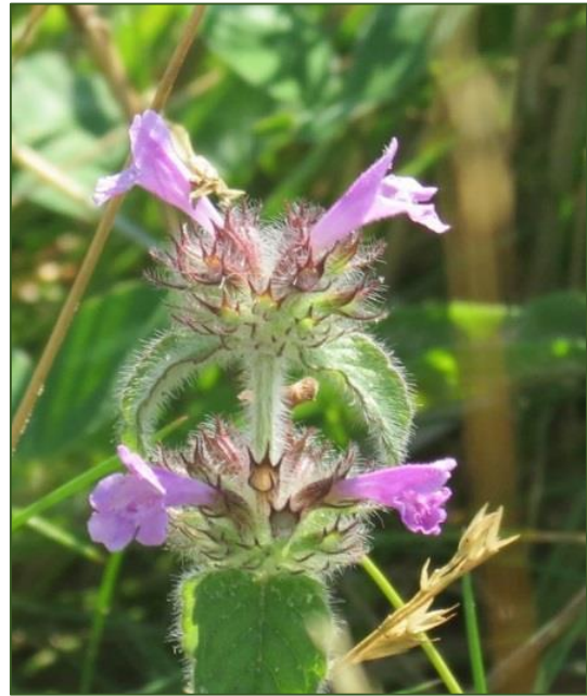
Clinopodium vulgare

237-484 Wierden, retentiegebied Wendelgoor (Otto Zijlstra & Pieter Stolwijk)