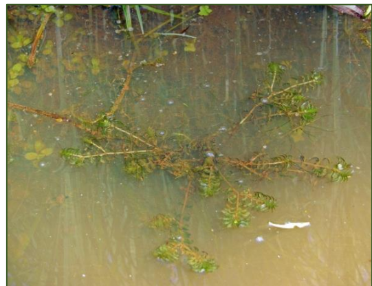
Groenlandia densa

228-470 Herikervliet (Otto Zijlstra & Pieter Stolwijk)