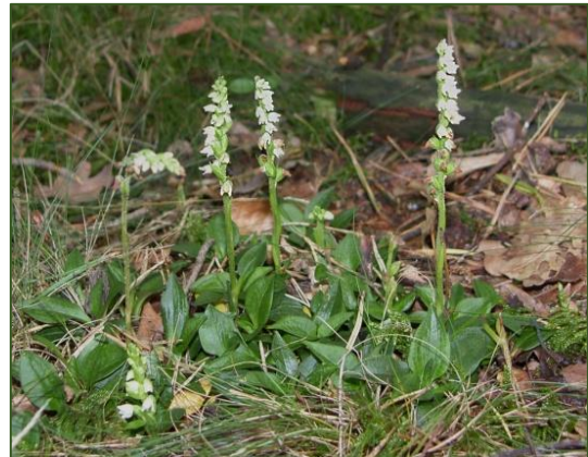
Goodyera repens

West-Twente (Herman Bruggink & Gerwin Timpers)