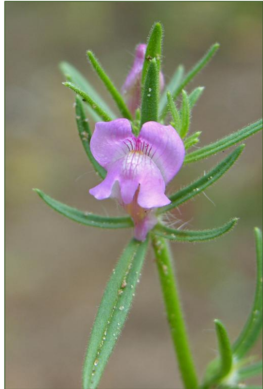
Misopates orontium

258-481 Oldenzaal, De Thij (Andries van Rensen)