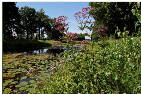
Eupatorium purpureum