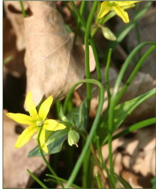
Gagea spathacea