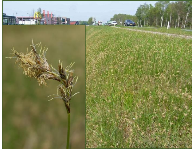
Carex ligerica

234-486 Wierden. Berm N35 (Pieter Stolwijk)