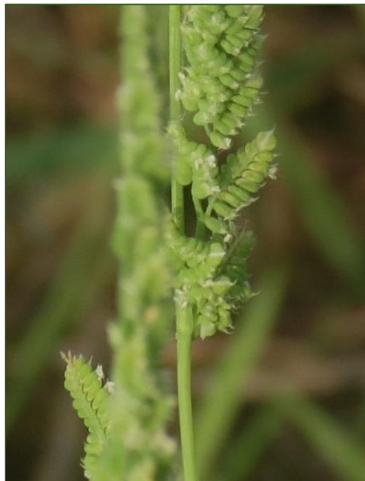
Beckmannia syzigachne