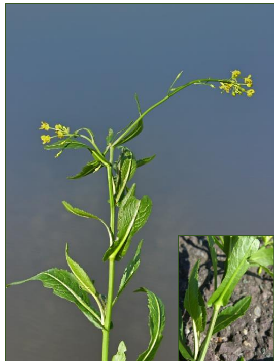
Rorippa x hungarica