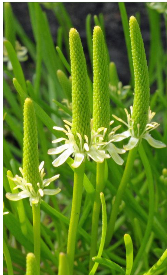
Myosurus minimus