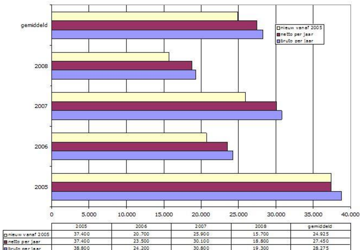
Waarnemingen Standaardlijst 2005-2008

In de grafiek, tabel 1 en de kaart zijn de resultaten verder uitgewerkt.