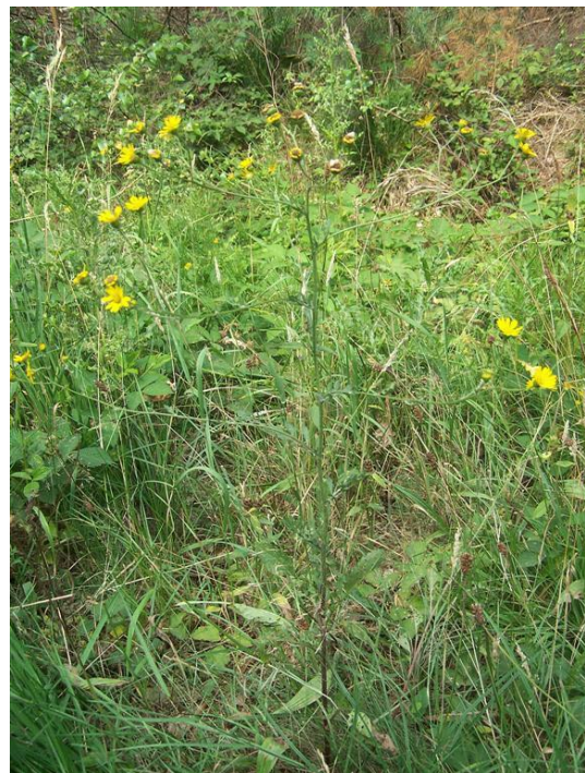
Waterkruiskruid var. erratica