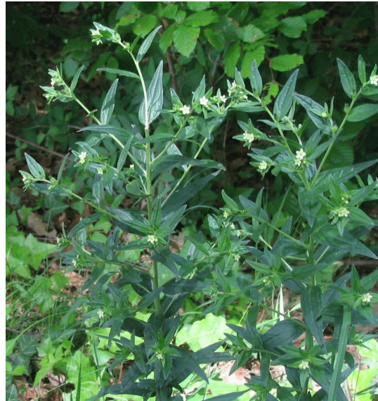
Glad parelzaad

Langs de Oude Postweg ter hoogte van Boerskotten bij de Lutte (230-497), tientallen planten. Dit taxon onderscheidt zich van de variëteit aquatica door kleinere lintbloemen en een lossere, meer uitstaande bloeiwijze. (O.G. Zijlstra)