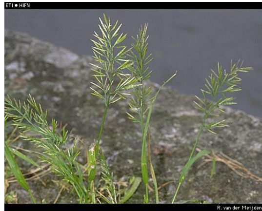
Afb.2 Stijf hardgras.