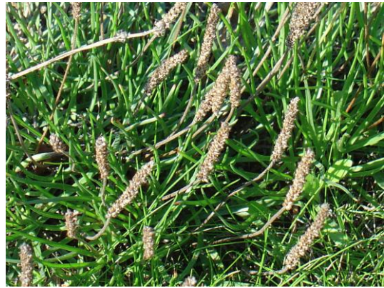
Afb.4 Zeeweegbree