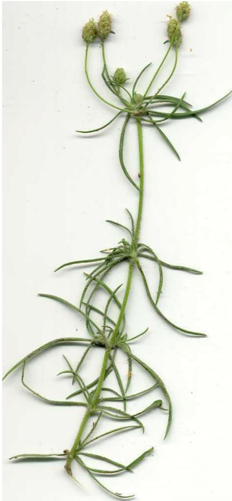
Afb.3 Zandweegbree