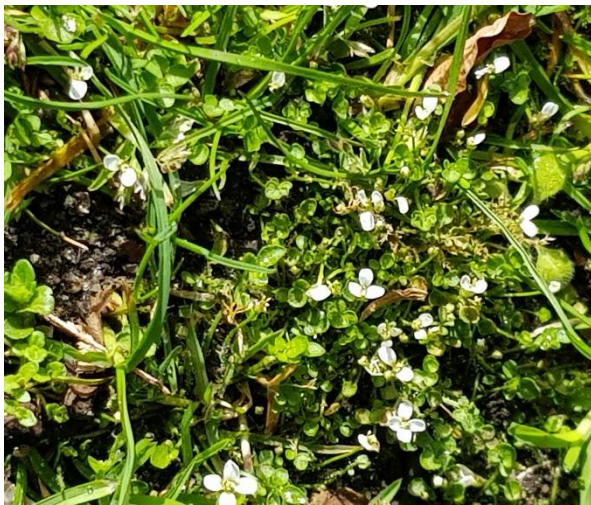
Nieuw-Zeelandse veldkers

Na een mooie zonnige maand maart, begon april met een koude en natte week. Hoewel de excursie aan het eind van die periode zat, was de weerverwachting niet uitnodigend. Naast droge perioden moest er rekening worden gehouden met stevige buien. De temperatuur, van circa 10 graden was ook niet geweldig. Toch waren er zeven personen voor de excursie.