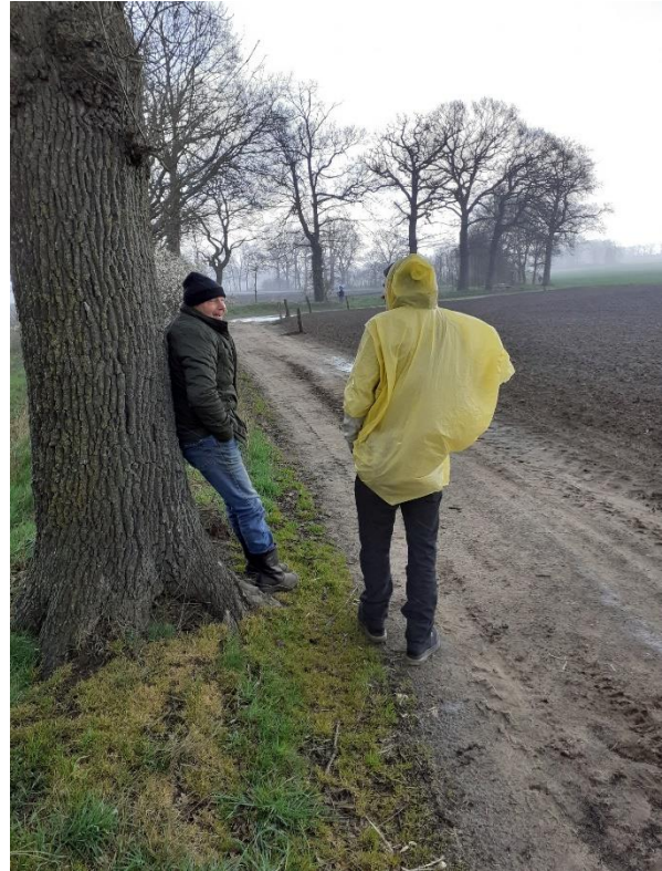
Even een dipje