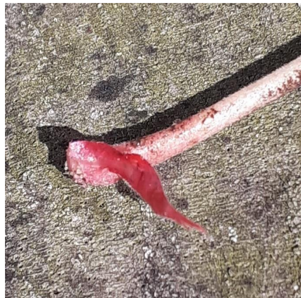
Bermooievaarsbek: bladsteel met steunblad

Via twee zandpaden gingen we over de Esch. Het viel op dat de Brem ( Cytisus scoparius ) tegen de bloei aan zit. Even later een flinke regenbui met hagel. Iedereen zocht een schuilplek op.