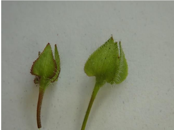
links: Bosklimopereprijs; rechts: Akkerklimopereprijs.